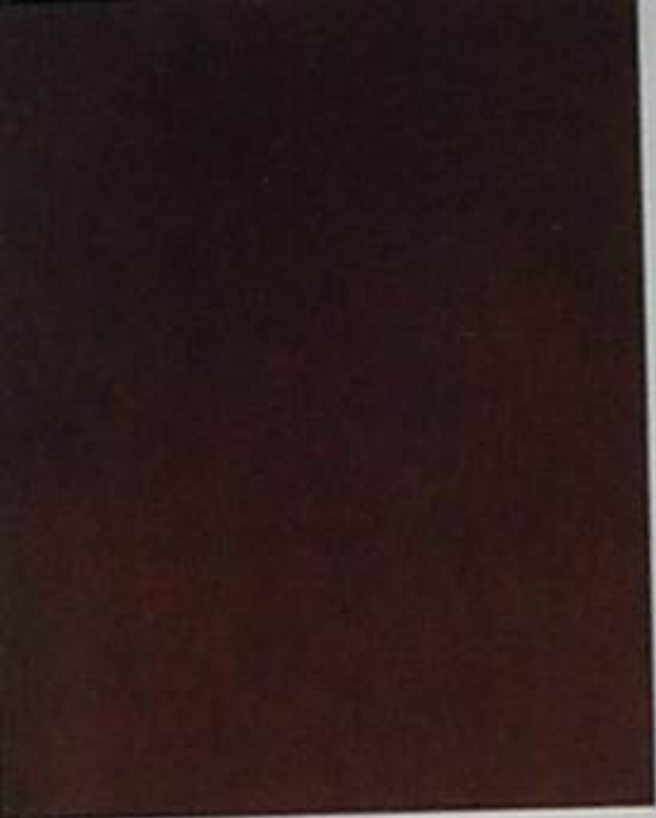
C Sa 1