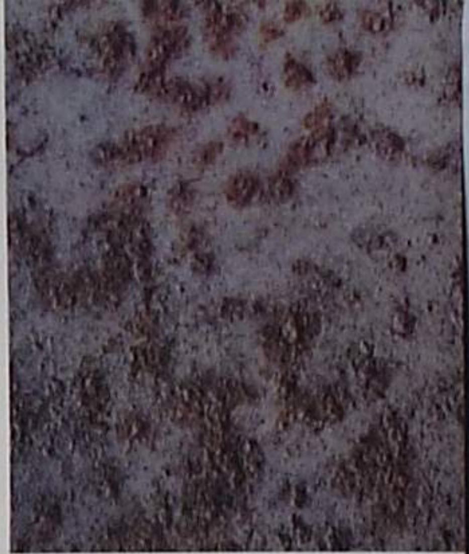
D Sa 2