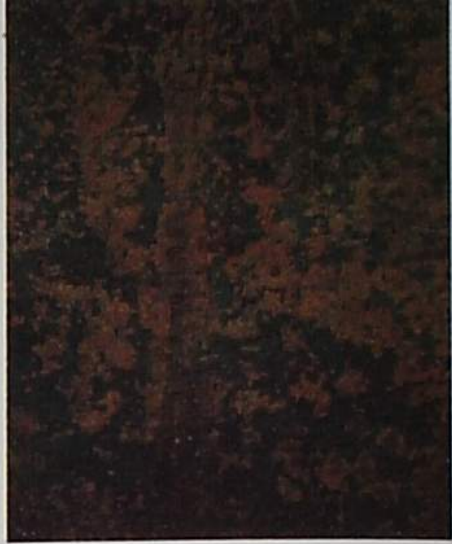
B St 3