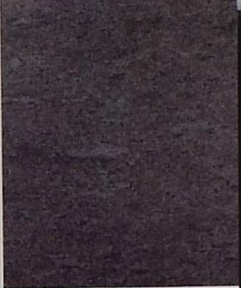
B Sa 2