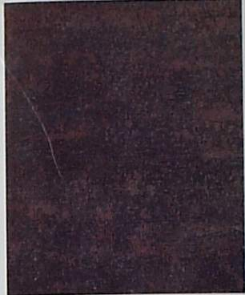
B Sa 1