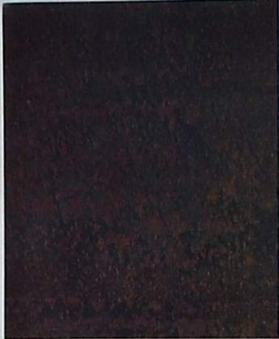
B St 2