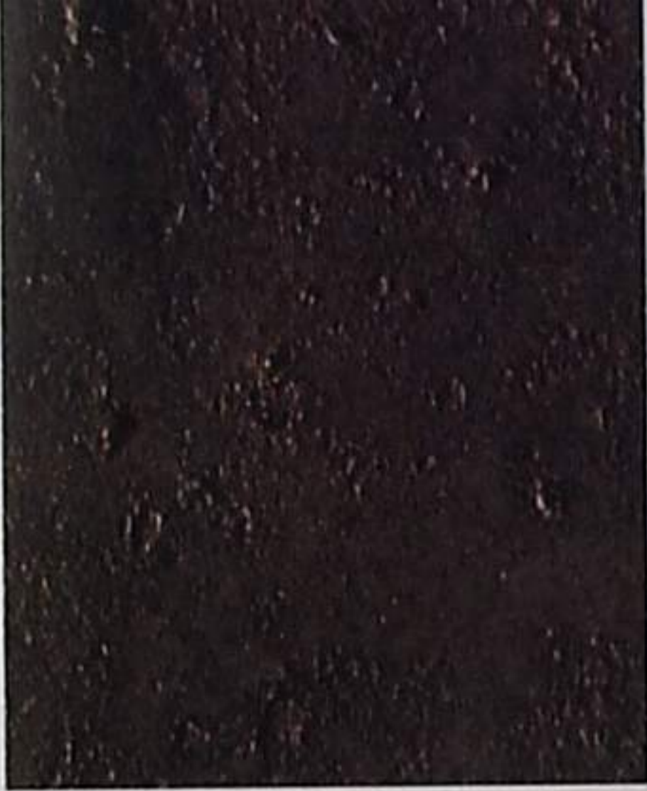
D Sa 1