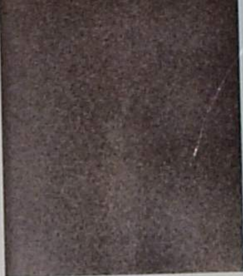
C Sa 2